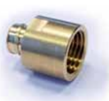
Raccordo per guaina RTA