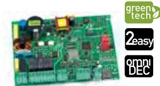
Scheda elettronica E045 Caratt. tecniche a pagina <?>