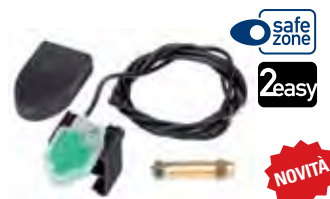
SAFEcoder encoder assoluto magnetico bus (Brevetto FAAC)