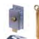
Accessori vari pagina <?>