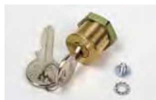
Serratura di sblocco con chiave personalizzata