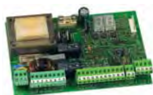
Scheda elettronica 455 D (ad esaurimento) Caratt. tecniche a pagina <?>