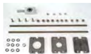
Positive Stop - arresti meccanici ap./ch (integrabili sul mod. 400 lungo)