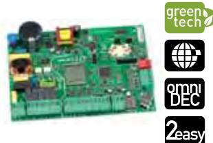
Scheda elettronica E145 Caratt. tecniche a pagina <?>