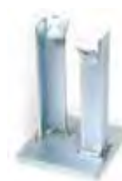
Piastra a murare